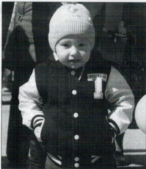
Первомай глазами будущего

П ервомай порадовал гремячинцев ярким тёплым солнышком после длительной и прохладной весны. Тысячи горожан разного возраста пришли на городскую площадь с шариками и цветами, чтобы отметить Праздник Весны и Труда.