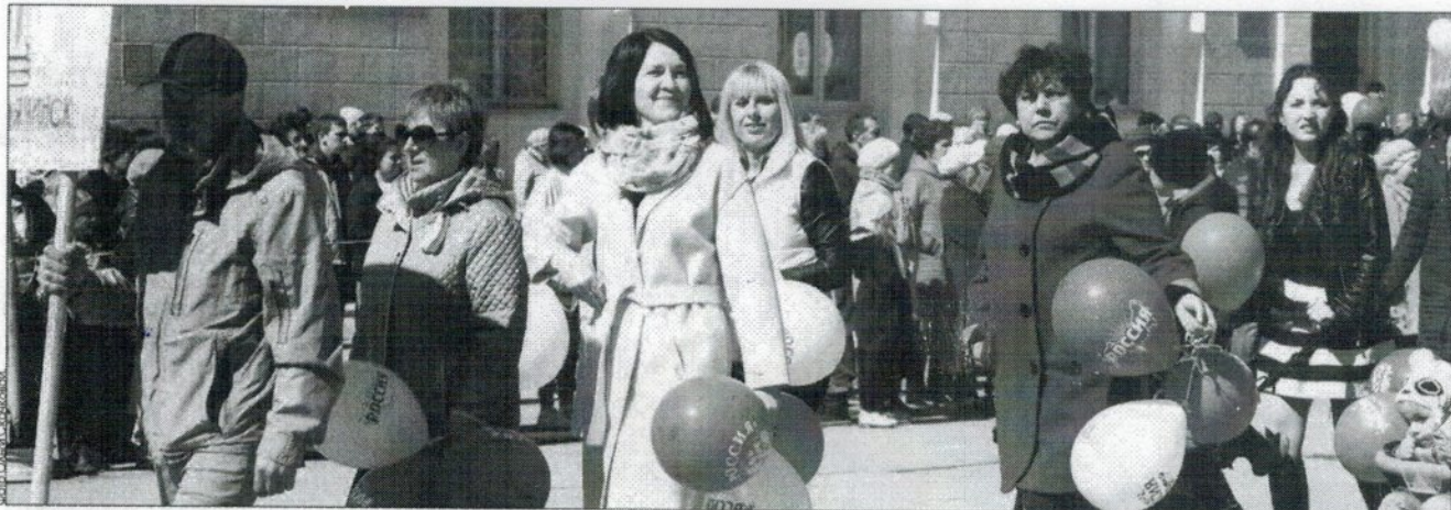
Праздник объединил гремячинцев