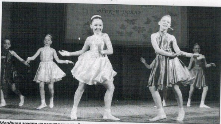
Младшая группа коллектива народного танца «Радуга»

21 апреля творческие коллективы Дворца культуры приняли участие в межмуниципальном фестивале «Веснушки», проходившем в Кизеле. Младшая группа коллектива народного танца «Радуга» заняла третье место. Вокальная