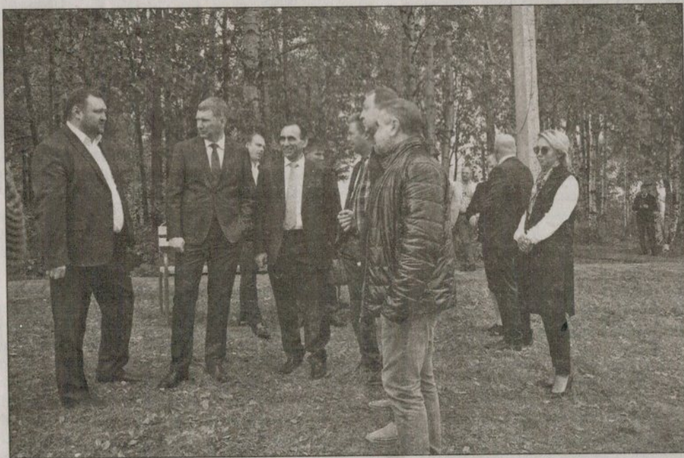
Благоустройство на детской площадке, построенной Гремячинским ДОКом, должно быть продолжено

P.S. Рабочий визит Максима Решетникова в города КУБа закончился поздно вечером. 25 августа он также провёл совещание по подготовке к отопительному сезону 2018-2019, посмотрел, как идёт ремонт в инфекционном отделении губахинской больницы, осмотрел отделение сестринского ухода в Кизеле, побывал на открывшемся после реконструкции стадионе «Шахтёр», швейном производстве «Инициатива», в Губахе — на строительстве комплекса «Аммиак-карбамид-меламин», которое ведёт ПАО «Метафракс».