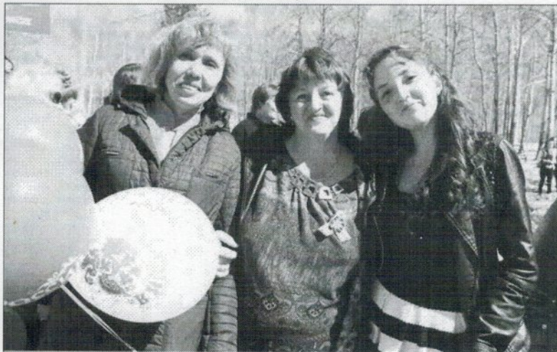
1 Мая – день встреч и улыбок